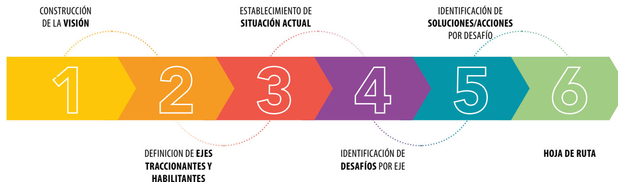
IMAGEN 27 PASOS DEL PROCESO DE CONSTRUCCIÓN DE UNA HOJA DE RUTA

primer paso que señala una dirección para construir un marco de referencia desde el cual generar sinergias a través de la identificación de desafíos y soluciones.