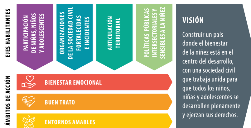
IMAGEN 28 ESTRUCTURA DE NÚCLEOS Y VISIÓN DE HOJA DE RUTA

En el caso de esta Hoja de Ruta, la definición de ámbitos se realizó en una sesión de trabajo junto al Grupo Motor, donde se tomaron en cuenta temáticas clave a abordar para favorecer el bienestar de la niñez, llegando a una propuesta final de tres ámbitos de acción y cuatro ejes habilitantes.